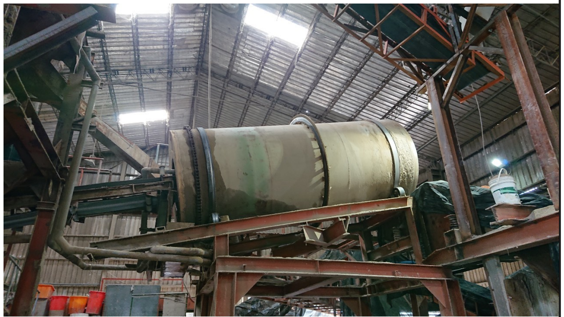
11. (未登記滾筒篩選機)