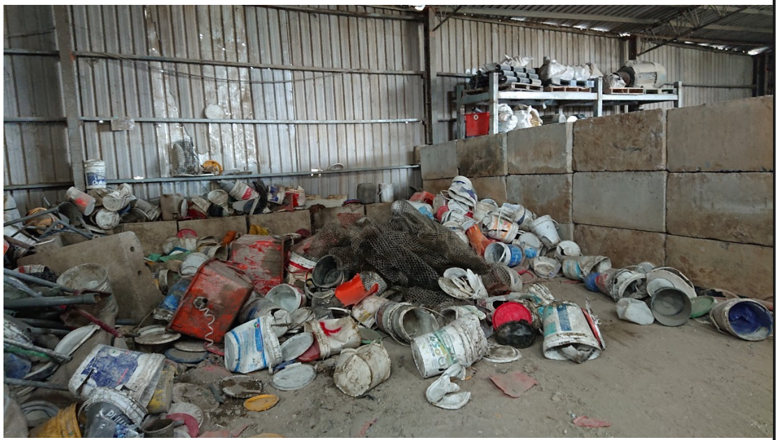
13. (X012廢棄物混合物堆置場)