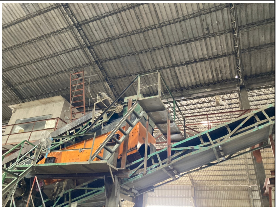
10. (C001輸送帶+未登記滾筒篩選機)