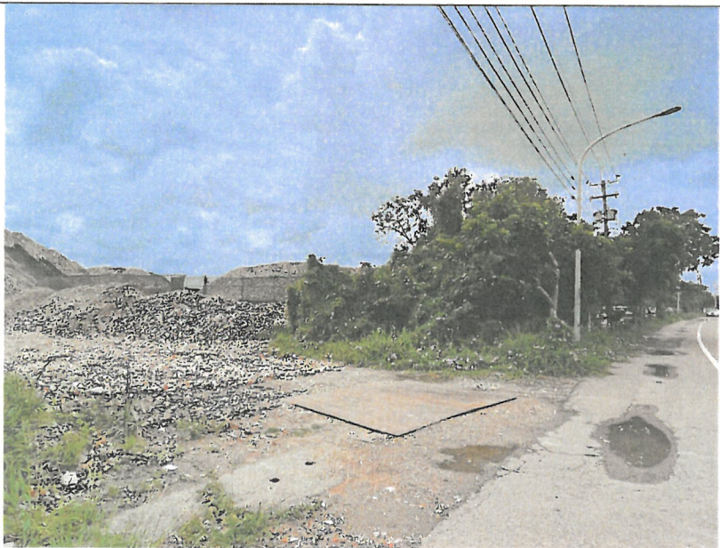
違規使用鄰地海墾段 86 及 78 地號堆置土方，設置第 2 出入口