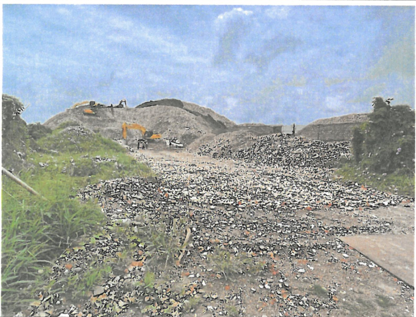
違規使用鄰地海墾段 86 及 78 地號堆置土方