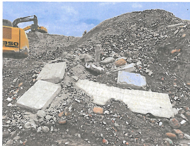
違規使用鄰地海墾段 86 及 78 地號堆置土方