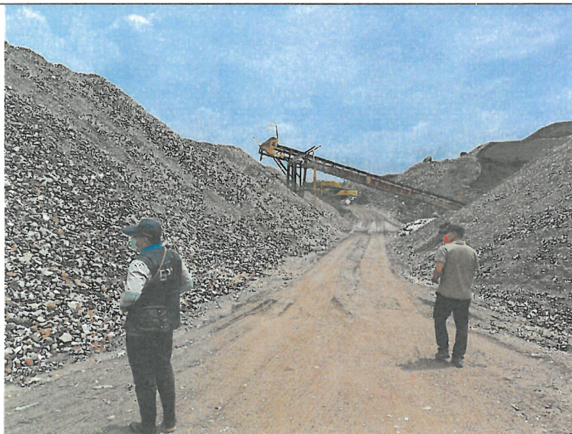
現場堆置過高，超出核准高度